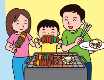
こども施設・自然体験・スポーツクラブなどと連携