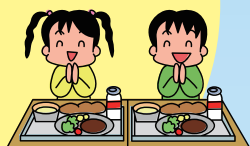
保育園・幼稚園・児童クラブなどと連携